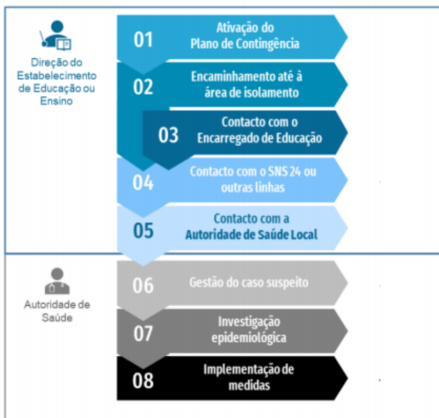
Figura 1. Fluxograma de atuação perante um caso suspeito de COVID-19 em contexto escolar

Perante a identificação de um caso suspeito, devem ser tomados os seguintes passos: