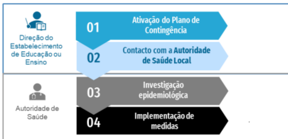
Figura 2. Fluxograma de atuação perante um caso confirmado de COVID-19 em contexto escolar

Se o caso confirmado tiver sido identificado fora do estabelecimento ensino, devem ser seguidos os seguintes passos: