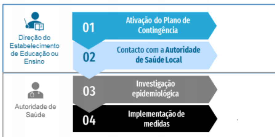
Figura 2. Fluxograma de atuação perante um caso confirmado de COVID-19 em contexto escolar

Se o caso confirmado tiver sido identificado fora do estabelecimento de educação e/ou ensino, devem ser seguidos os seguintes passos: