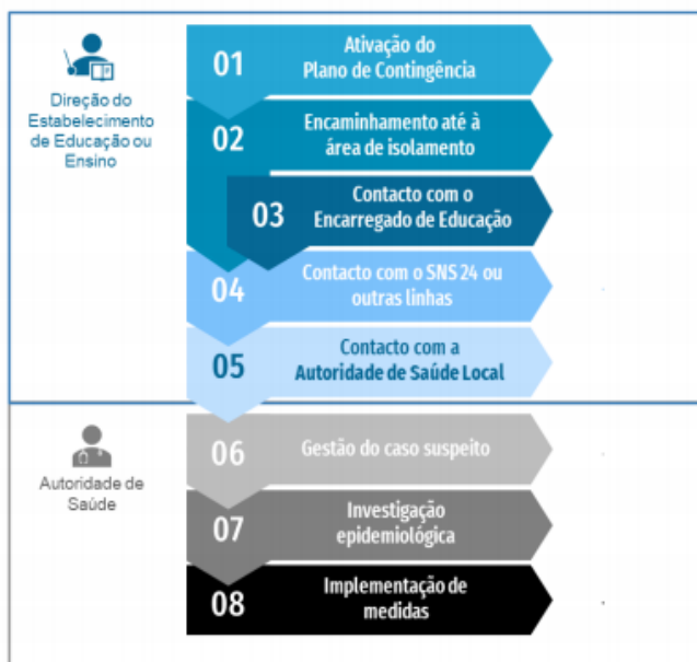
Figura 1. Fluxograma de atuação perante um caso possível ou provável de COVID-19 em contexto escolar